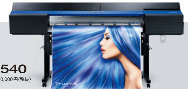
VG-540 標準価格 2,480,000円(税抜)