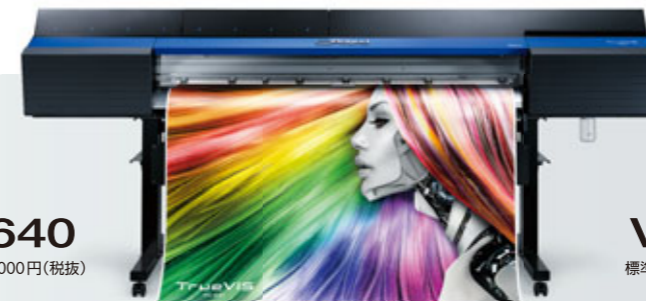
VG-640 標準価格 2,880,000円(税抜)

8 Colors : CMYKLcLmLkWh 7 Colors : CMYKLcLmLk 4 Colors : CMYK (CMYKを各2本)