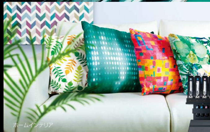
ホームインテリア