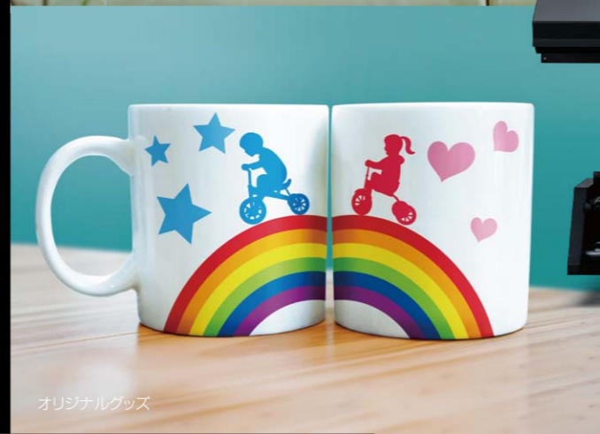
オリジナルグッズ