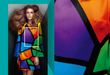
色鮮やかなオレンジ、バイオレットを引き締まったブラックでメリハリのある発色を実現