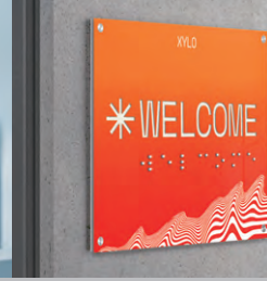
サイングラフィック