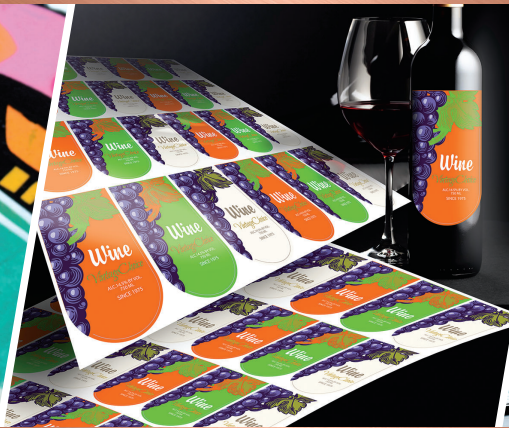
オリジナルラベル