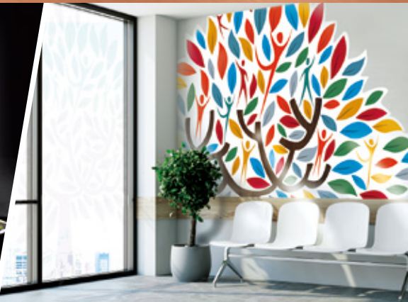
ウィンドウディスプレイ／ウォールデコレーション