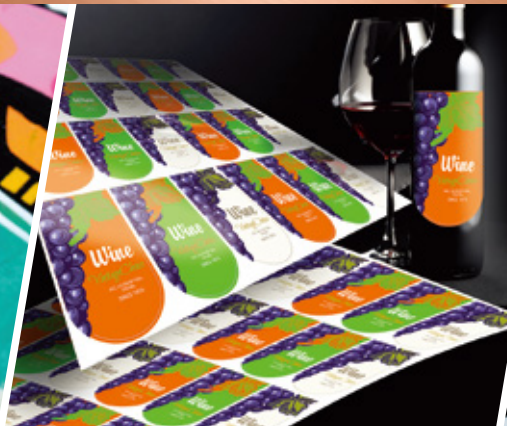
オリジナルラベル