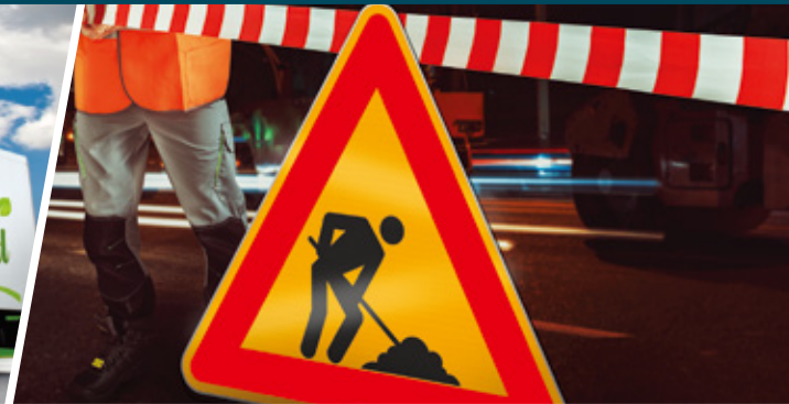
交通標識／工事用看板