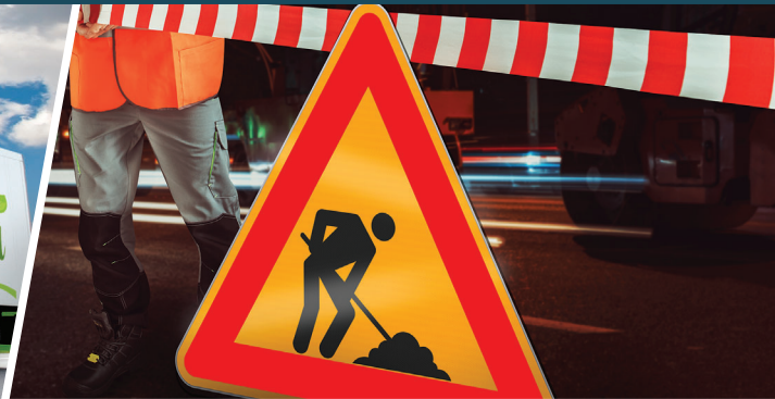
交通標識／工事用看板