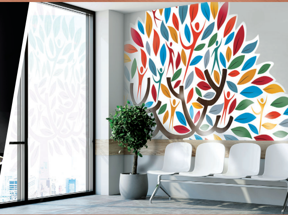
ウィンドウディスプレイ／ウォールデコレーション