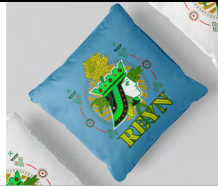
インテリアグッズ