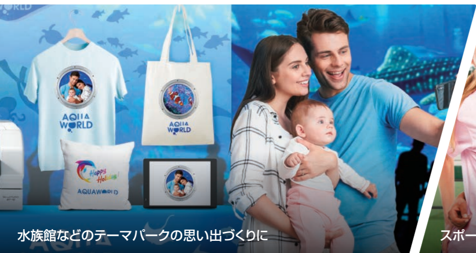
水族館などのテーマパークの思い出づくりに