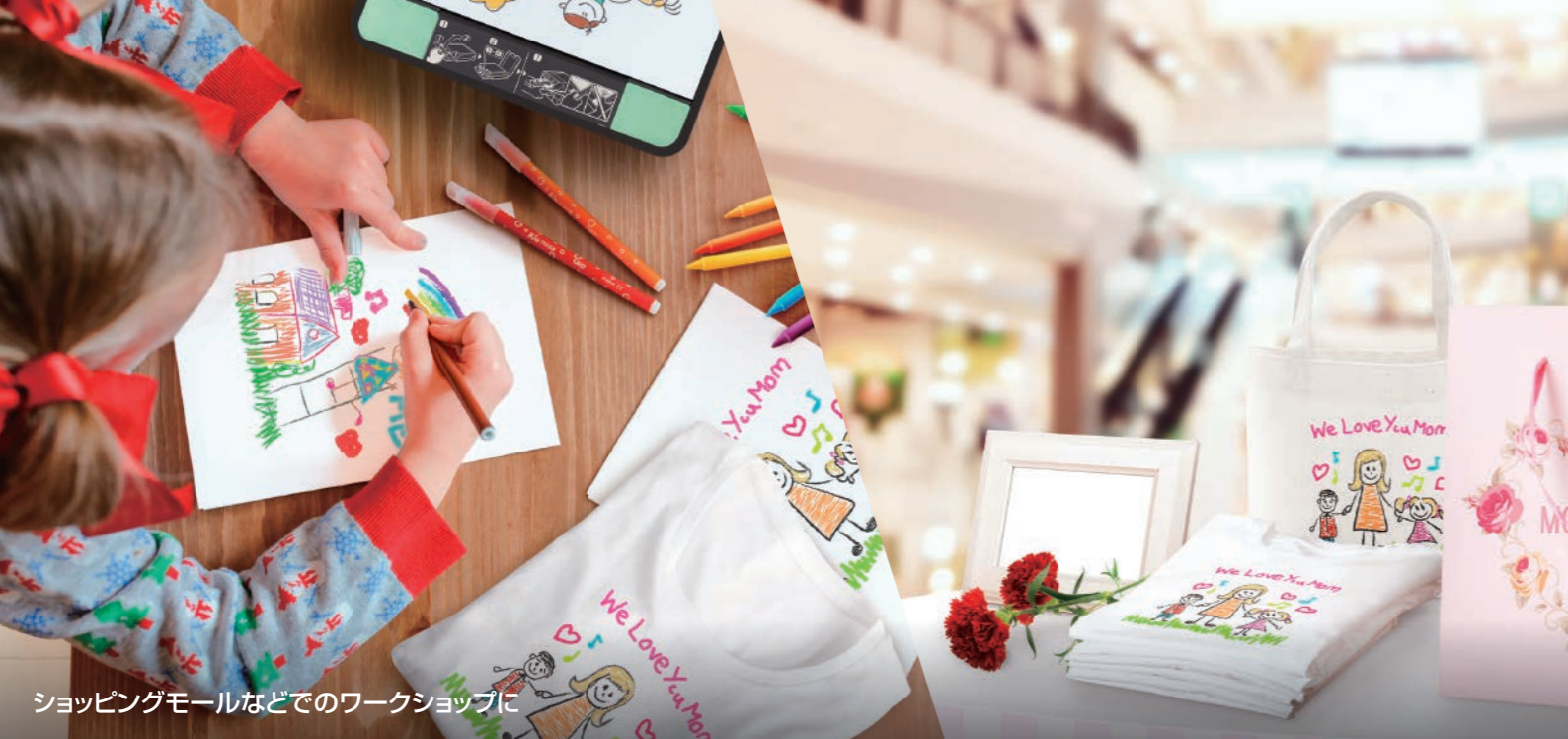
ショッピングモールなどでのワークショップに