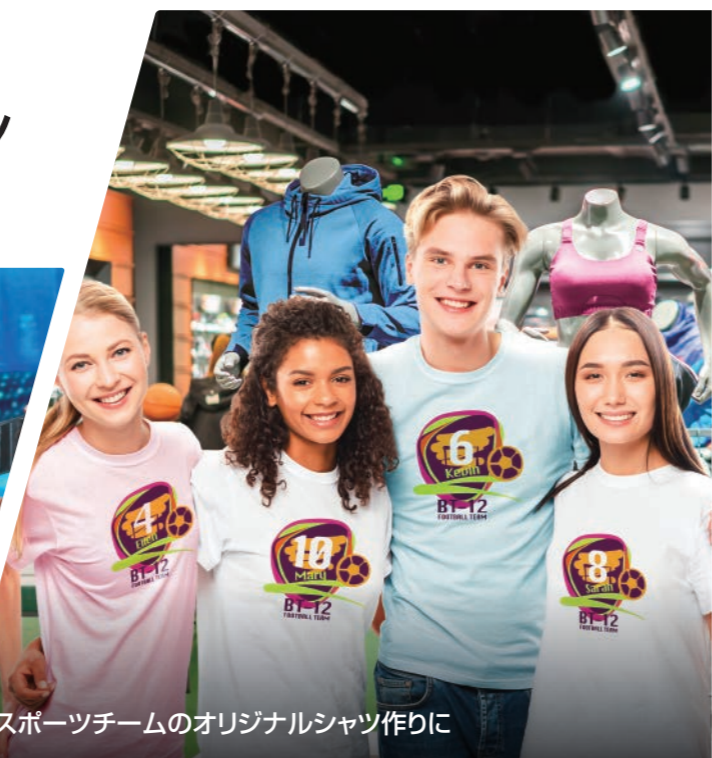
スポーツチームのオリジナルシャツ作りに