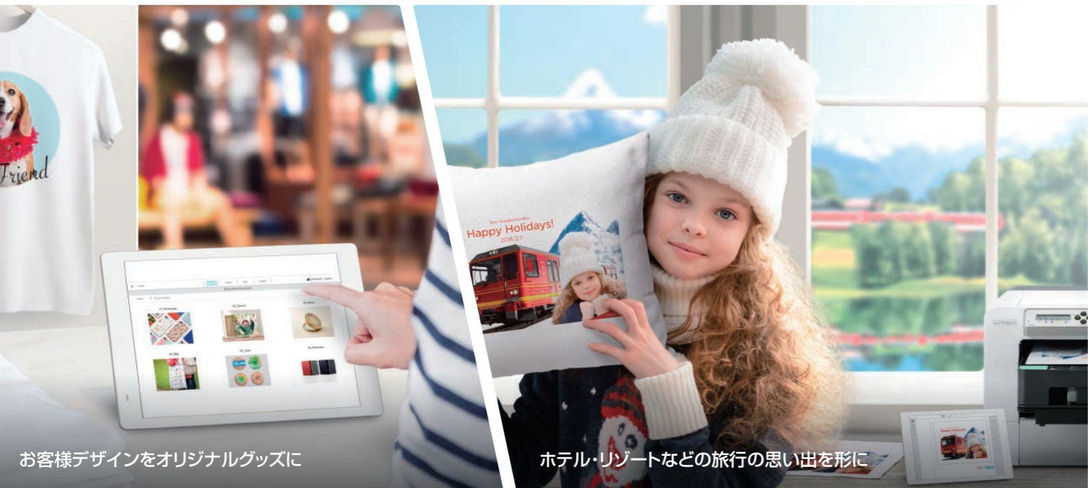
お客様デザインをオリジナルグッズに