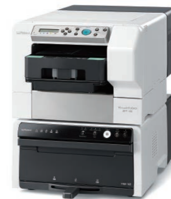
※写真は、仕上機(HB-12)を装着した状態です。

綿素材に直接プリントできる、デスクトップサイズのガーメントプリンター VersaSTUDIO BT-12。Tシャツやトートバッグ、インテリアグッズなど、さまざまなアイテムに簡単にプリントでき、お客様のニーズに応えるパーソナライズプリントサービスを手軽にはじめられます。